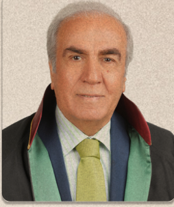
Av. Prof. Dr. Ahmet M. Kılıçođlu 4821