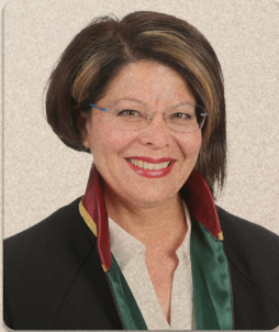
Av. Nebile Kısa İnce 11545

CMK Merkezi; Adli Yardım Kurulu; Spor Kurulu eski üyesi