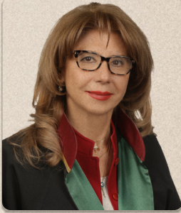
Av. Berlin Gündođan 8952